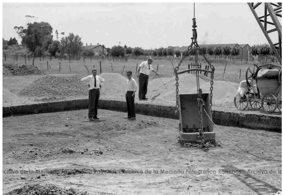
Prof: Manó en 2da imagen en la construcción de la pileta (con corbata)